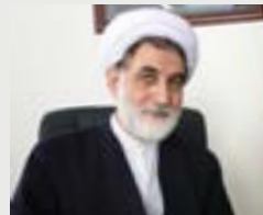
حجت الاسلام والمسلمین

دفتر نهاد رهبری واحد تهران جنوب برای دستیابی به اهداف فوق فعالیت